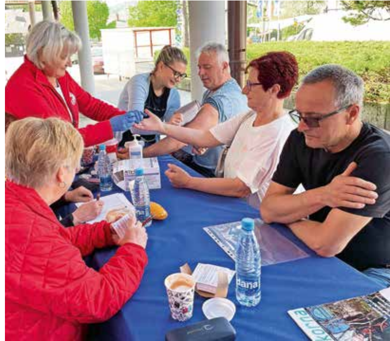
Meritve krvnega sladkorja sredi maja / Foto: Tanja Mlinar

Žirovci se dobro odzivajo tudi na razne meritve, ki so preventivnega značaja in spodbuda za varovanje zdravja in zdravega načina življenja. V Tednu Rdečega križa smo spet lahko organizirali meritve krvnega sladkorja in tlaka, v sodelovanju z Društvom bolnikov z osteoporozo Kranj pa UZ merjenja kostne gostote na petnici, ki se ga je udeležilo 47 oseb. Bernarda Lukančič je naredila tudi kratko statistiko meritev krvnega sladkorja: »Meritve se je udeležilo 15 oseb, starih med 30 in 40 let, 24 oseb, starih med 60 in 70 let (dve osebi z visoko vsebnostjo krvnega sladkorja), 51 oseb, starih od 70 do 80 let, 38 oseb, starih od 80 do 90 let (ena oseba z visoko vsebnostjo