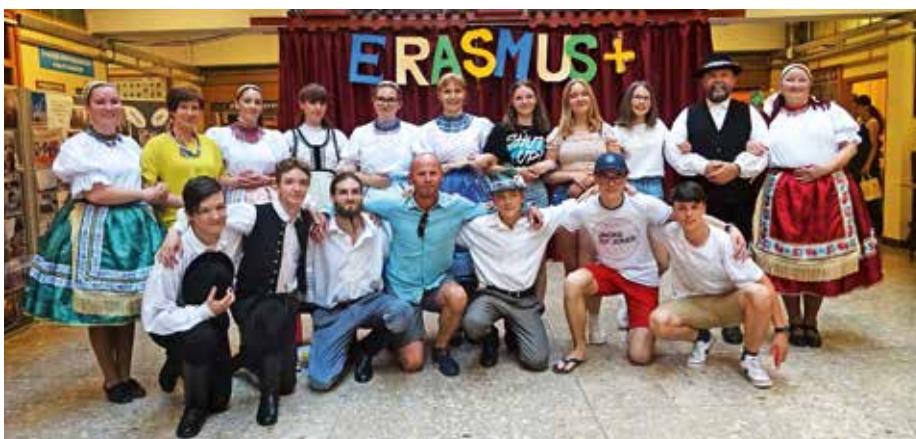
V sklopu projekta Z igro proti nasilju so gostovali na Madžarskem.