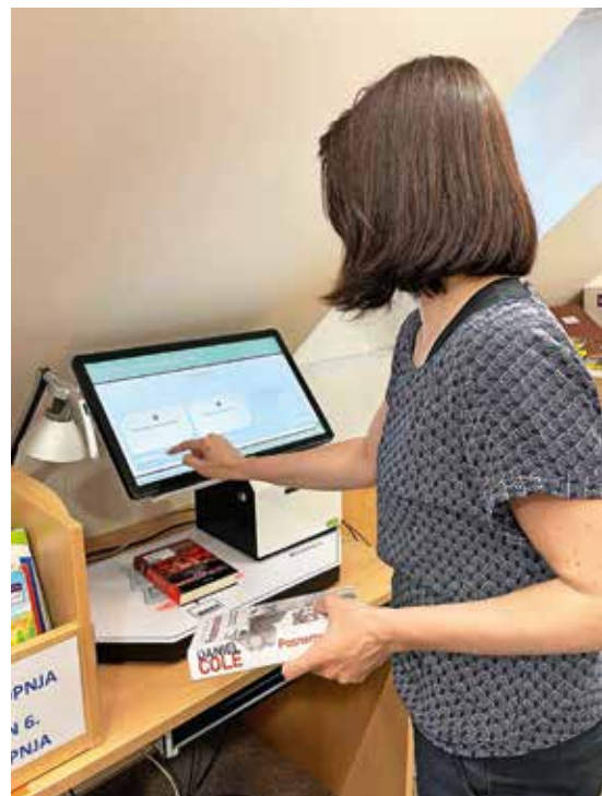
V knjižnici v Žireh je po novem na voljo »knjigomat«.

Za več informacij o uporabi naše nove tehnologije vam predlagam obisk knjižnice še pred poletjem. Poletni dnevi bodo tako mirni in brezskrbni, saj bo na vaši knjižni polici vedno nova in sveža literatura.