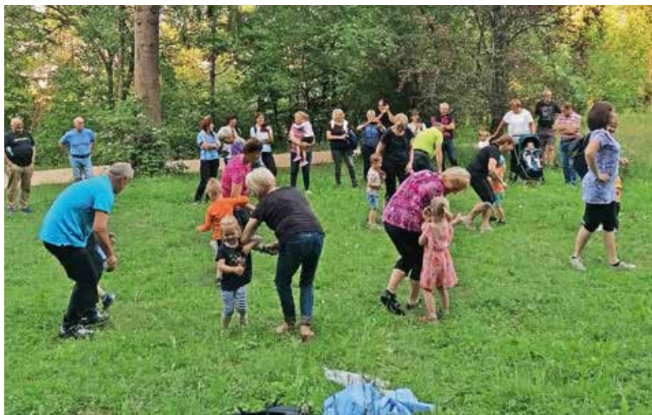
Otroci kombiniranih skupin so vrtčevski dan preživali z dedki in babicami. / Foto: arhiv vrtca

V vrtcu je na veliko veselje vseh letos ponovno zaživel tudi medgeneracijsko sodelovanje in druženje. Tako so v