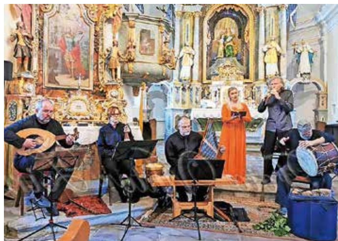
Koncert skupine Canso – mednarodnega ansambla za staro glasbo

Mednarodna zasedba prekaljenih glasbenikov je z glasbeno zbirko Cantigas de Santa Maria iz 13. stoletja, ki jo je dal zapisati kastiljski kralj Alfonso X., sledila povezovanju raznovrstnih kultur takratnega sveta v miroljubno in ustvarjalno sobivanje treh religij: krščanstva, islama in judovstva. Vse to se izraža v glasbi, kjer se mešajo evropski in arabski vplivi, posvetna glasba z liturgično, ljudska s prefinjeno glasbo provansalskih trubadurjev. V tem prostoru in času deluje presenetljivo sodobno, umerjeno po merah in razpoloženjih zdajšnjega poslušalca, ki se ji z lahkoto pusti zapeljati in navdušiti. Zgovorno dejstvo, da se je publika glasbenikom zahvalila s stoječim aplavzom, potrjuje zapisane besede. Dokaz več, kako glasba ne pozna meja, časovnih okvirjev, ki jih ime