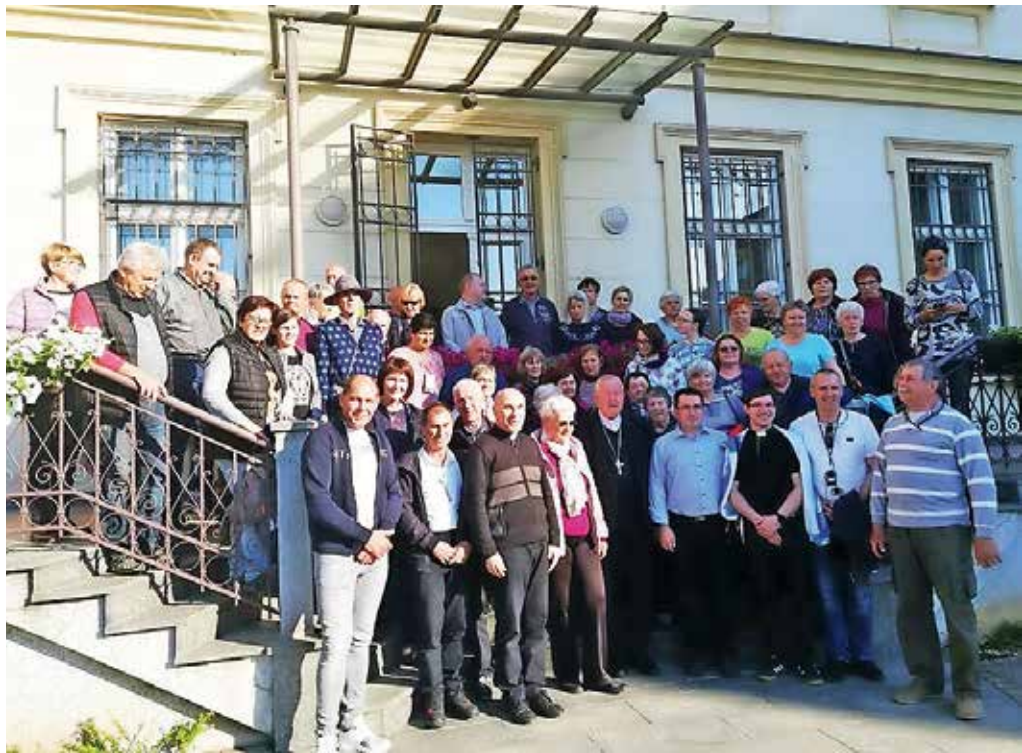
Udeleženci romanja v Srbijo in Severno Makedonijo

Molimo rožni venec. Kljub temu da je veliko sveta po Šumadiji neobdelanega, je Srbija druga v Evropi po pridelovanju malin, prva je Rusija. Prispemo v Niš. Ogledamo si kapelico z vzdanimi glavami srbskih junakov, ki so jih premagali Turki 1809. leta. Nato ogled ostan-