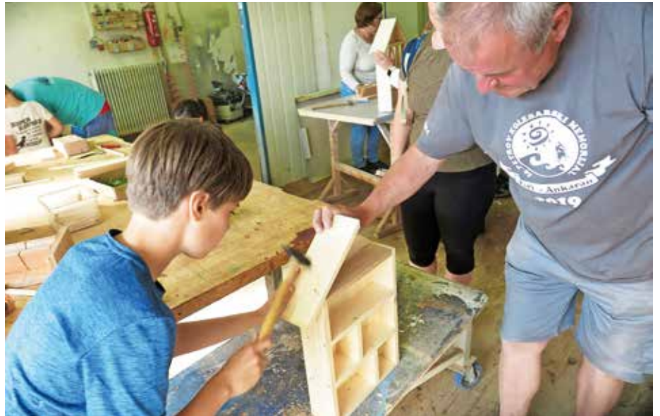
Na delavnici LU Škofja Loka so izdelovali hotele za žuželke.