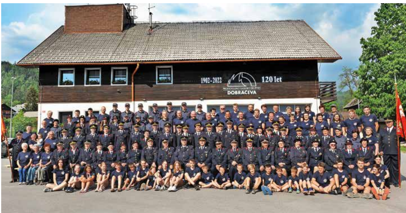
PGD Dobračeva praznuje 120-letnico delovanja.

S pomočjo denarnih sredstev Občine Žiri in Uprave za zaščito in reševanje RS ter lastnih in sponzorskih sredstev smo v zadnjih desetih letih nabavili za več kot 150.000 evrov različnega gasilskega orodja in druge gasilsko-reševalne opreme ter zaščitnih sredstev. Poleg tega smo organizirali ali se udeležili več kot štiristo operativnih gasilsko-reševalnih vaj večjega in manjšega obsega. Tu velja omeniti večkratno izvedbo Tehnično-reševalnega dneva PGD Dobračeva, skupnih vaj gasilskih enot šir-