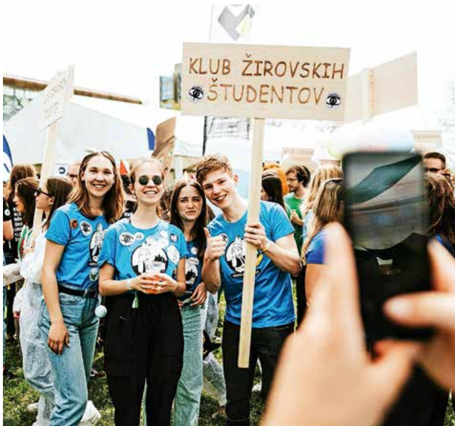
Klub žirovskih študentov na Škisovi tržnici

Sicer se je prireditve poleg našega kluba udeležilo še 54 študentskih klubov iz celotne Slovenije. Klubi smo bili po regijah razporejeni v šest tako imenovanih otočkov. Na gorenjskem otočku so obiskovalci našli tudi našo stojnico. Tam so pokušali Burnikovo ocvirkovo potico in pa pijačo brucemor, ki jo sicer pripravimo brucem na vsakoletnem brucovanju KŽŠ. V popoldanskem delu so potekale klubske igre, na katerih je zmagala naša, torej gorenjska regija. Zvečer pa so ob dveh odrih obiskovalci uživali ob glasbi različnih glasbenih izvajalcev. Med drugim so nastopili Zmelkoow, Vlado Kreslin in Mali bogovi, Mi2 ter Siddharta. Dogodka se je udeležilo več kot 28 tisoč obiskovalcev.